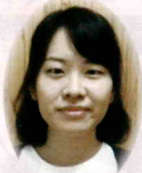
産山村立産山学園 産山村学校給食センター