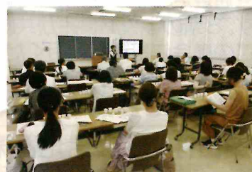
▼阿蘇郡市学校給食担当者等研修会の様子