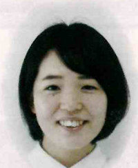
天草市立牛深中学校 牛深学校給食センター