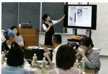
▼宇城学校給食会ふれあい教室の様子