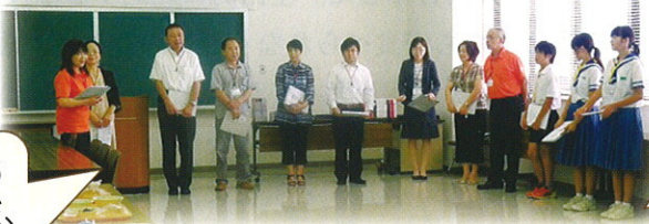
給食献立調理発表会